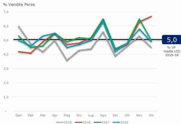
Figura 2 - Vendite perse nel periodo 2015-2018

Fonte: Barometro ECR GS1 - IRI - Largo Consumo Confezionato - Ipermercati+Supermercati