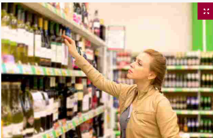
Nel 2018 giù le vendite di vino in Italia, crescono di poco i valori, dati Iri

Stenta la ripresa dei consumi di vino in Italia, almeno a guardare i dati della grande distribuzione, dove si vende ben oltre la metà delle bottiglie consumate nel Belpaese. Italiani, dunque, disposti a spendere qualcosa in più, ma a patto di bere decisamente meno, e se la bottiglia è ancora il formato di gran lunga preferito, a crescere è soltanto il bag-in-box, che resta ancora di gran lunga, però, minoritario.