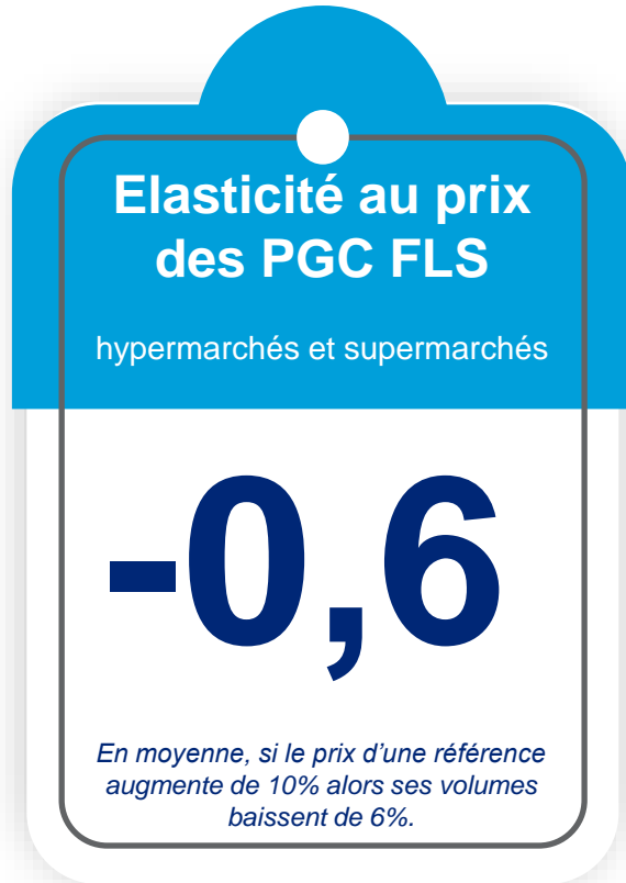
Elasticité au prix des PGC FLS par grand rayon indice vs le circuit

Dans un contexte de contraction des volumes et de retour de l'inflation, activer précisément le levier prix est précieux.